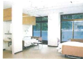
2人室 (30.36㎡) 7室