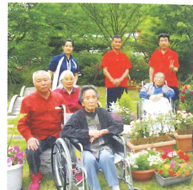
レクリエーション庭園探索

要支援・要介護者が、送迎を受けてデイサービスセンターへ通い、入浴や食事のお世話、機能訓練、レクリエーションなどのサービスを受けることにより、心身機能の維持向上や孤立感の解消を行うことができます。また、日常お世話する家族の方々の身体的・精神的な負担も軽減します。