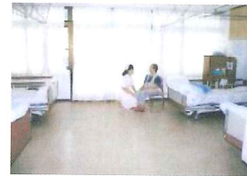
4人室 (43.2.㎡) 8室