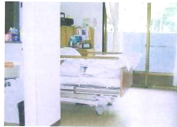
個室 (14.4㎡) 24室

要介護者で、家庭において、介護を受けることが困難な方が入所する施設です。食事、入浴、排泄などの日常生活のお世話や、レクリエーションなど身体の機能の向上のための援助を行います。